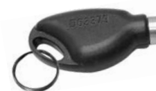
RÉF : CM400 Clé contact avec numéro gravé