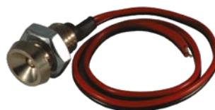
RÉF : TM400V Lecteur à visser \varnothing 24 mm Profondeur d'encastrement : 45 mm \varnothing de perçage : \varnothing 18 mm