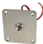
RÉF : TM400S Tête de lecture pour montage encastré, profondeur : 45 mm