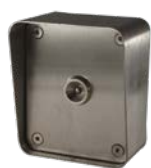
RÉF : TM400A Tête pour montage Boîtier en applique extérieur

La tête de lecture contact en inox est étanche et anti-vandale. Elle se raccorde à la centrale via 2 fils, par une paire torsadée blindée (réf. STXP2) aux centrales DKF2000 ou DKF100 sur une distance maximale de 50 mètres. Elle existe en 3 versions :