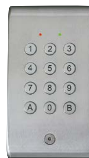
DK/CLAV300 Inox brossé