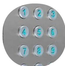
DK/CLAV200G Grain cuir