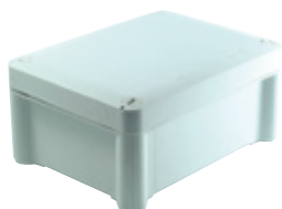
02560/03360/03520/03620 Boîtes face lisse avec couvercle vissé IP66