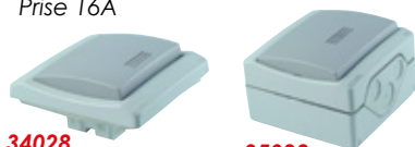
34028 Inter. va et vient lumineux