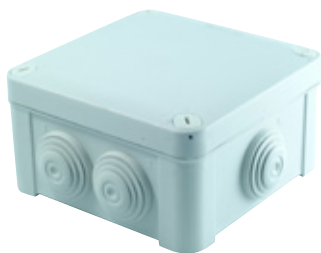
02500/03350/03550/03610 Boîtes avec entrées par embout vis métal IP55

A B C D E F G H I J K L M N O P Q R S T U