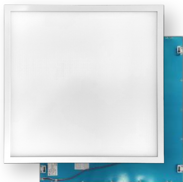
MS6060DT 600 x 600 x 10mm

Fixation sur le toit de cabine à l'aide des goujons