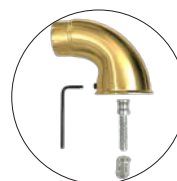
Fixation intérieur cabine par insert de 8 mm