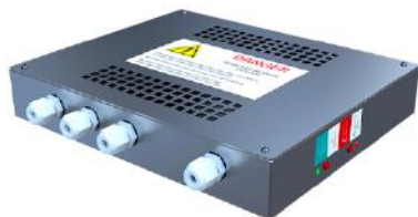
DCA400L/8W DCA400LDJ/8W (avec disjoncteur)

En cas de coupure de courant, le bloc secours DCA12 régénère via son onduleur une tension de 12V/24W (1h15)