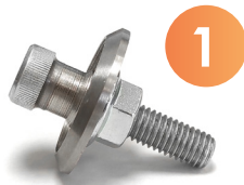
Fixation depuis l'extérieur de la cabine