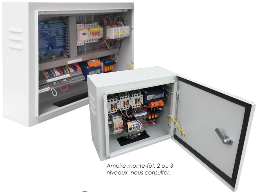
Armoire monte-fût, 2 ou 3 niveaux, nous consulter.

Notre service technique reste à votre disposition jusqu'au bon fonctionnement de l'installation